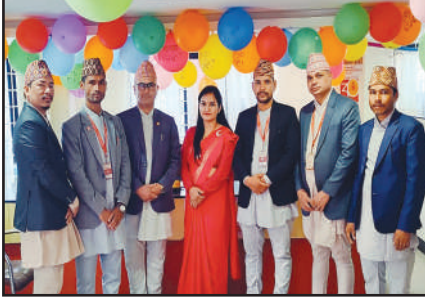
प्रथम स्थान हासिल गर्न सफल चैनपुर- बभाङ्ग शाखा

प्रादेशिक कार्यालयहरूबीच फोटो प्रतिस्पर्धा गरिएकोमा चैनपुर बभाङ्ग, ठुटिपिपल तथा हसुलिया शाखाले क्रमशः प्रथम, द्वितीय तथा तृतीय स्थान हासिल गरेका थिए।