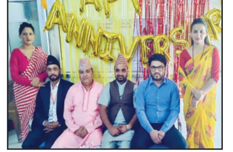
तृतीय स्थान हासिल गर्न सफल हसुलिया शाखा