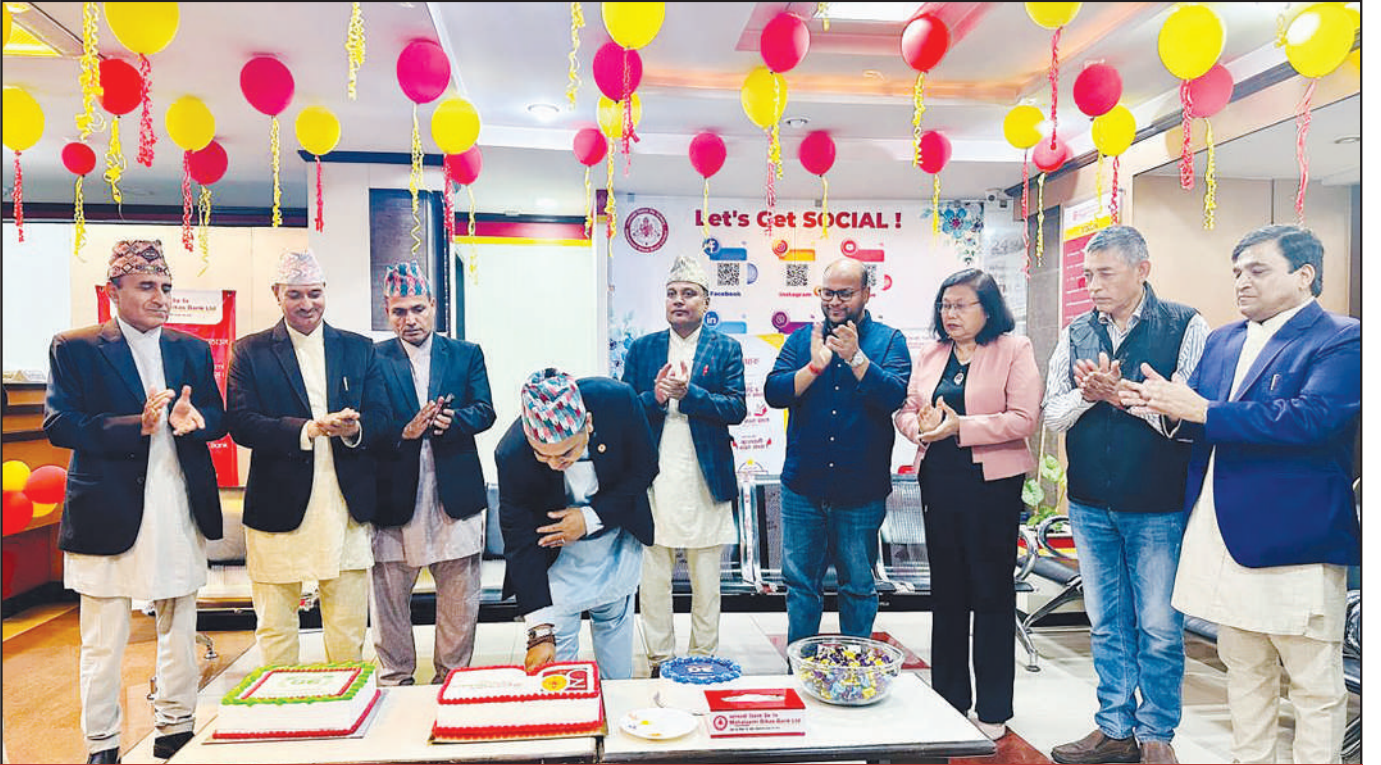
३० औं वार्षिकोत्सवको अवसरमा बैंकको केन्द्रीय कार्यालयमा आयोजना गरिएको कार्यक्रम

महालक्ष्मी विकास बैंक ३० औं वर्ष प्रवेश गरेको शुभ अवसरमा बैंकको केन्द्रीय कार्यालय लगायत १०३ वटै शाखा कार्यालयहरूमा केक काट्ने कार्यक्रम सम्पन्न भएको छ । बैंकको सञ्चालक समितिका