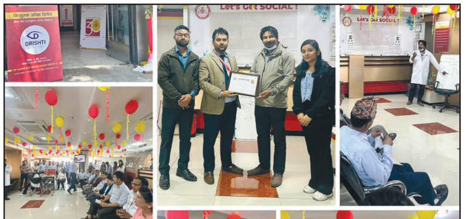
बैंकको केन्द्रीय कार्यालय, दरबारमार्गमा सञ्चालन गरिएको स्वास्थ्य तथा आँखा शिविरका केही भलकहरू

बैंकको केन्द्रीय कार्यालय दरबारमार्गमा मिति २०८१ साल जेष्ठ ८ गते र जेष्ठ ९ गते क्रमशः स्वास्थ्य शिविर तथा आँखा शिविर सञ्चालन गरिएको थियो।