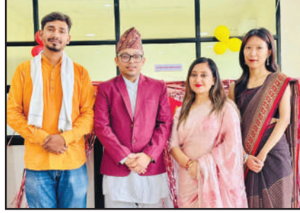
द्वितीय स्थान हासिल गर्न सफल ठुटिपिपल शाखा